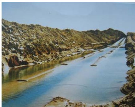
Pôsobenie prírodného živlu /záplava/