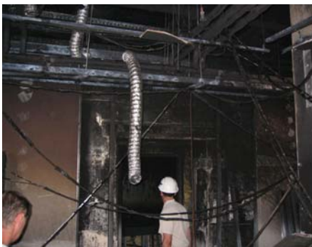
Požiar/výbuch hlavne následkom ľudskej činnosti